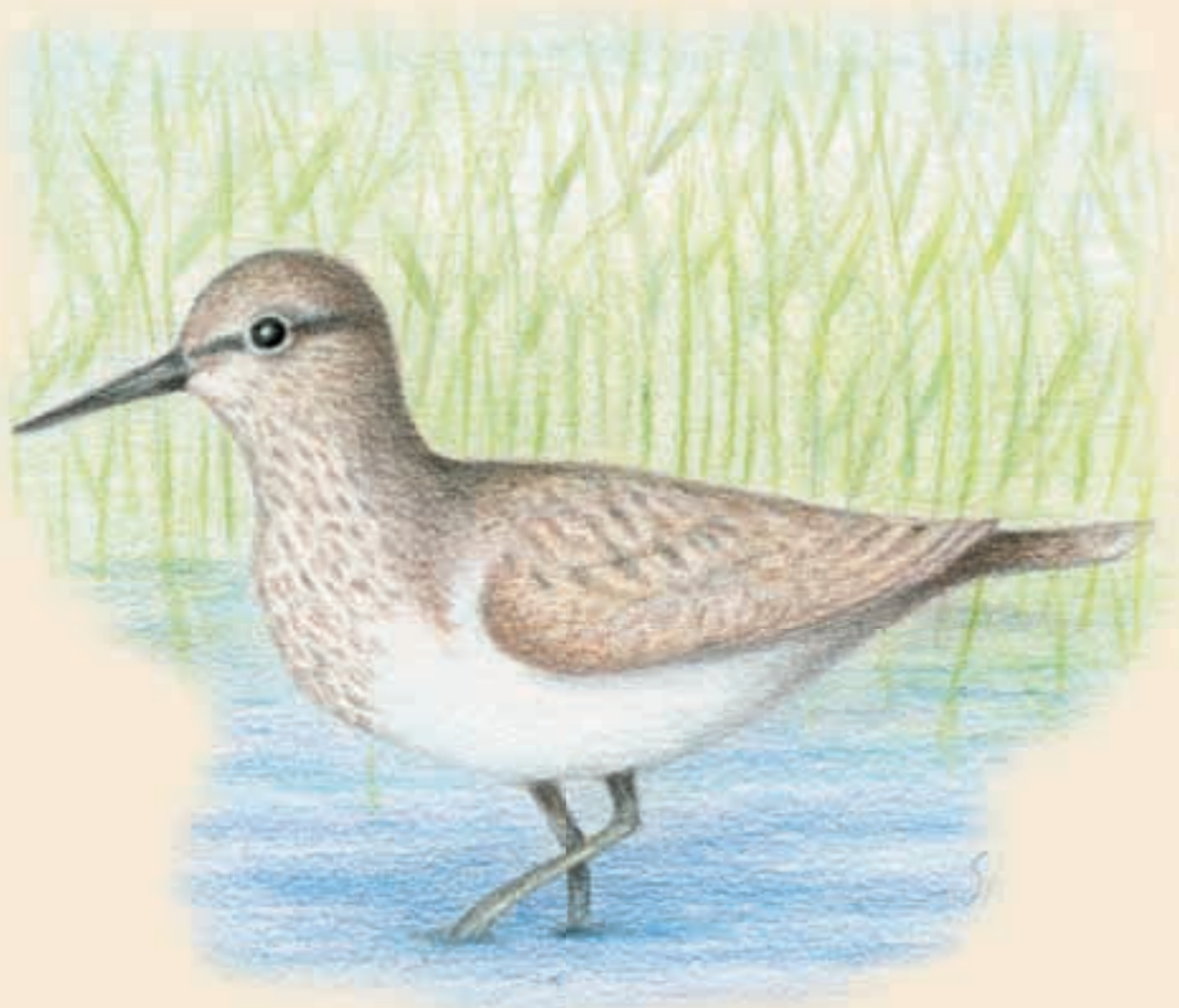
Rantasipi Actitis hypoleucos - Drillsnäppa - Common sandpiper

Rantasipin laulun synnystä kerrotaan vanhaa tarinaa. Kun yläkerran isäntä loi linnuille kieliä, se kutsui siivekkäät luokseen jaolle. Rantasipi unohtui silloin vesikivelle peilailemaan kuvaansa tynestä vedenpinnasta. Kun se lopulta tuli myöhässä jakopaikalle, kielet oli jo jaettu. Kysyttäessä missä rantasipi oli viivytellyt, se vastasi nolona "kivellä". Siten rantasipi sai laulukseen "kivelläviivyn- kivelläviivyn- kivelläviivyn-.."