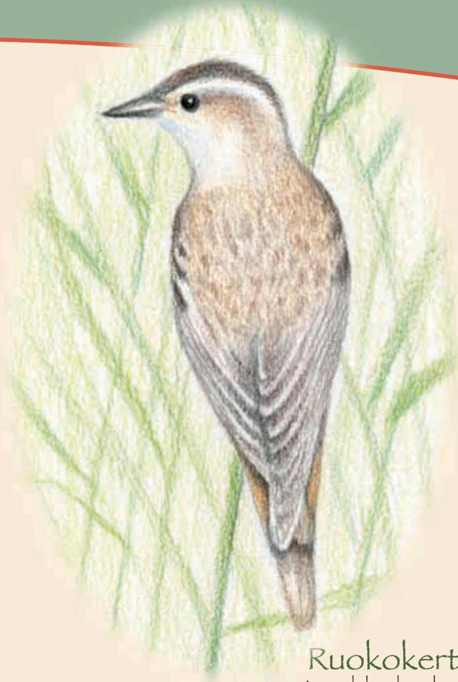
Ruokokerttunen Acrocephalus schoenobaenus - Sävsångare - Sedge Warbler

R antasipi lentää nopein värisevin siiveniskuina aivan vedenpinnan yläpuolella koko ajan äännellen 'tii-tii-tii'. Maassa ollessaan se keikuttaa pyrstöään taukoamatta. Varovaisena lajina rantasipi ei yleensä pesi aivan rannassa vaan rauhallisella rannalla varvikon kätkössä melko kaukana vedestä. Pieni kahlaaja viihtyy kaikenlaisten vesistöjen rannoilla.